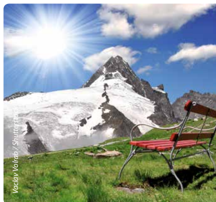
Vaclav Votraba / Shutterstock